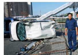
▼咲洲庁舎に隣接する駐車場の台風被害を視察

医療・福祉切り捨ての維新政治を変えたい。また、大阪の台風被害をすぐに調査し国会に届けました。