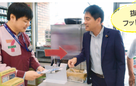
▲コンビニ店舗でオーナーから実態を聞き取る

不平等な契約に苦しむコンビニオーナーを実態調査。国会で取り上げ大きな話題に。現場に足を運ぶ、これが基本です！