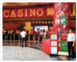
シンガポールのカジノを視察