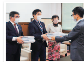
PCR検査の大規模実施を求める緊急署名を大阪府へ提出