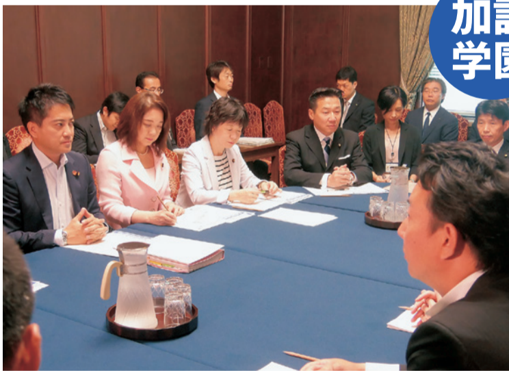
参院予算委員会で関係者の証人喚問を要求